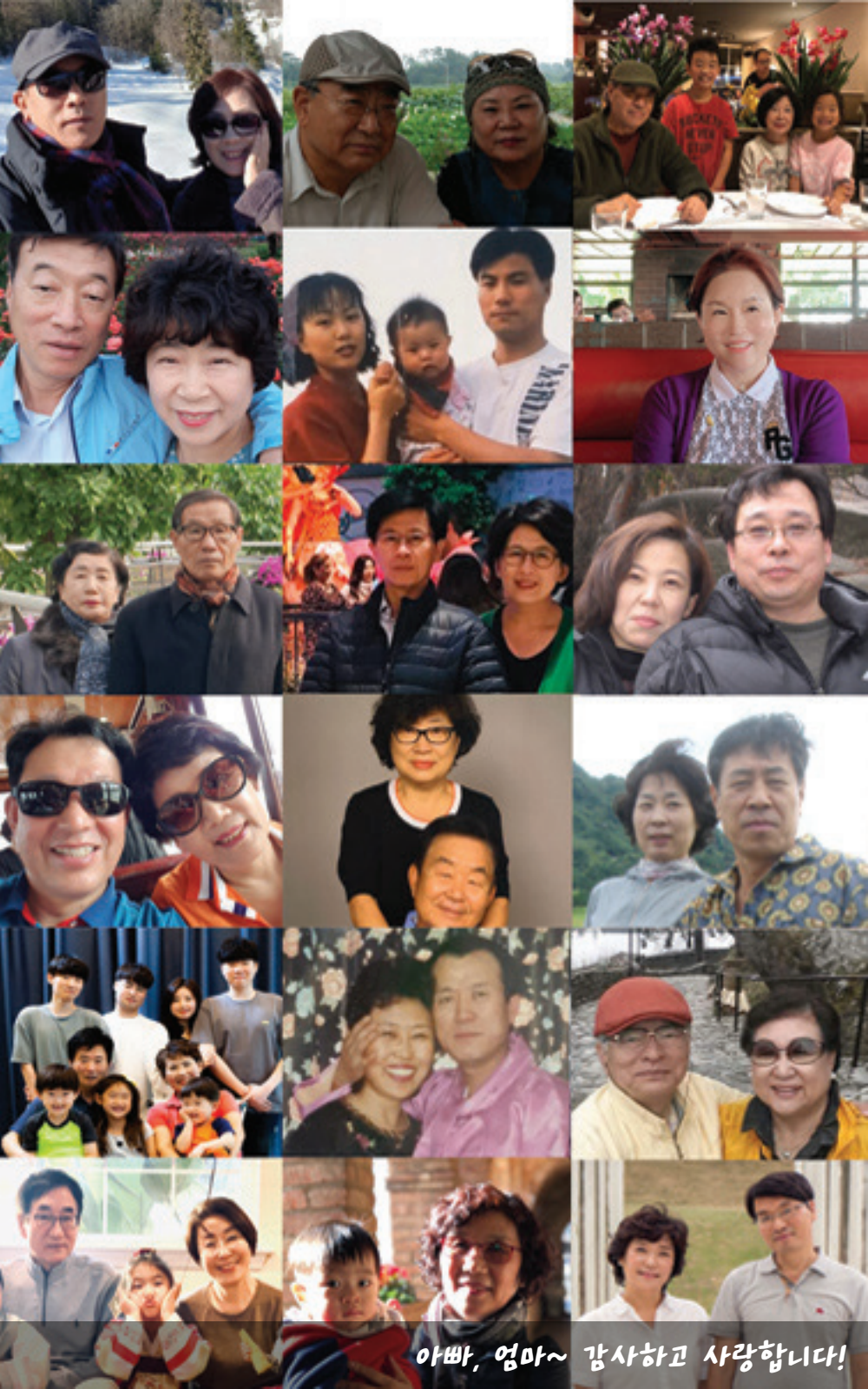
아빠, 엄마~ 감사하고 사랑합니다!